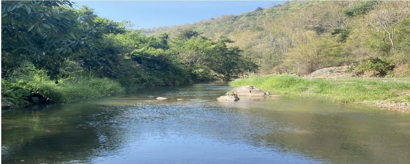
รูปตัดขวางลำน้ำ ปีน้ำ 2567 สถานี N.82 ห้วยน้ำรี อ.ท่าปลา จ.อุตรดิตถ์